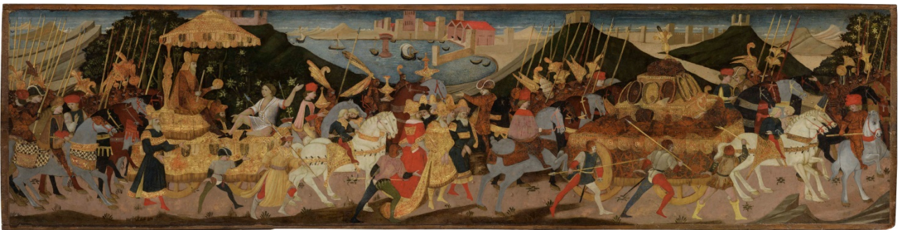
“Trionfo” di Apollonio Giovanni 1460 c.a.