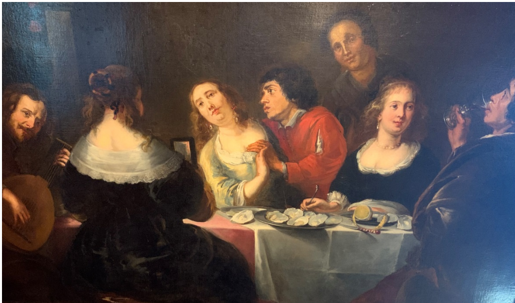
"Mangiatori di ostriche" Jan Roos 1620 c.a.