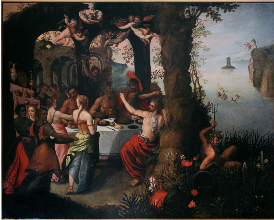
"Cena degli Dei" di Paolo Fiammingo o Francken, 1540.